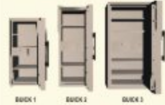
BUICK 1 BUICK 2 BUICK 3