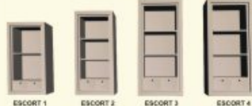
ESCORT 1 ESCORT 2 ESCORT 3 ESCORT 4