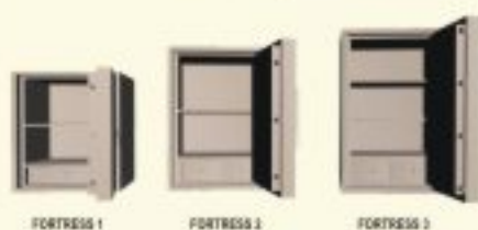
FORTRESS 1 FORTRESS 2 FORTRESS 3