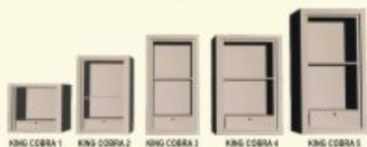
KING COBRA 1 KING COBRA 2 KING COBRA 3 KING COBRA 4 KING COBRA 5